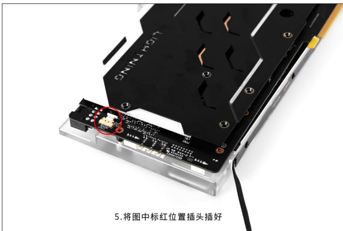
5. 将图中标红位置插头插好