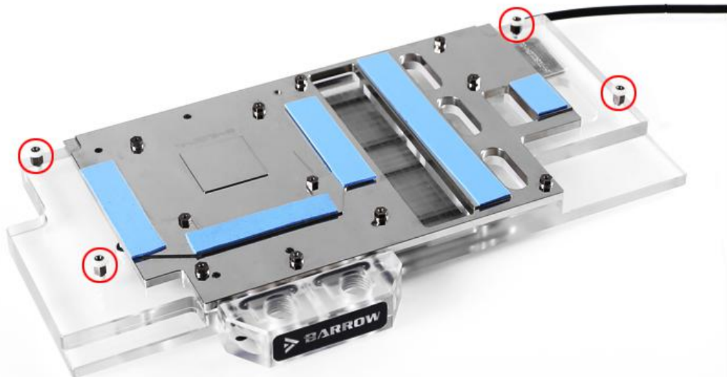
4.在相应位置贴好相应硅胶垫片,在标红六角铜柱上放好ABS垫片